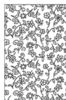
TAFL04 lana / Wool TAFL04S seta / Silk