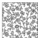
TAFL01 lana / Wool TAFL01S seta / Silk