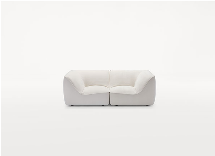
B33AS + B33AD