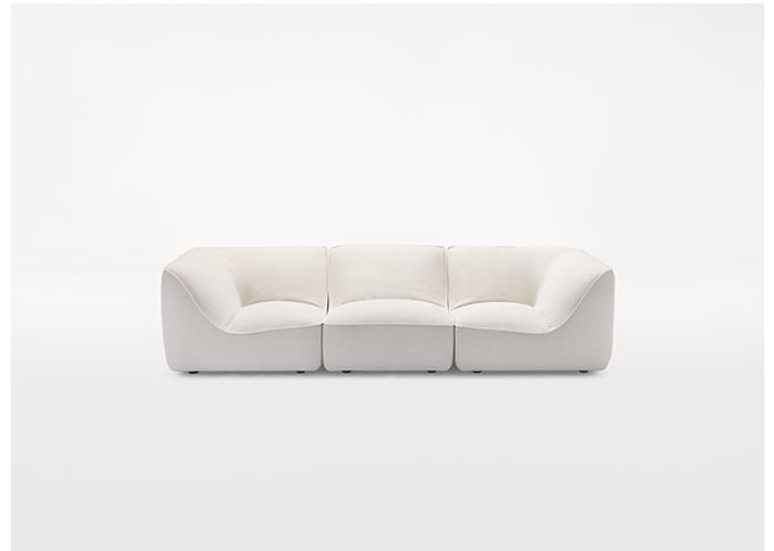
B33AS + D33B + B33AD