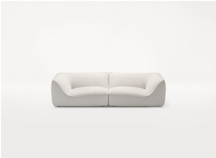
B33ES + B33ED