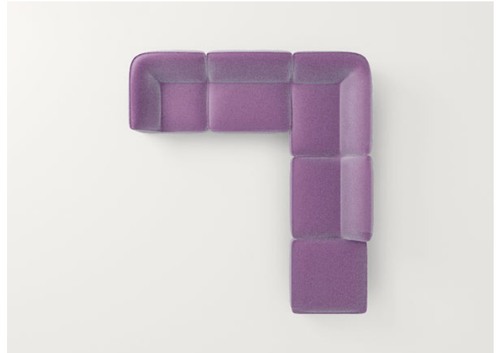
B33AS + n°2 B33H + B33ES + B33G