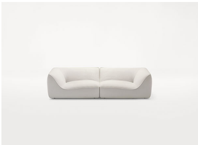
B33ES + B33ED