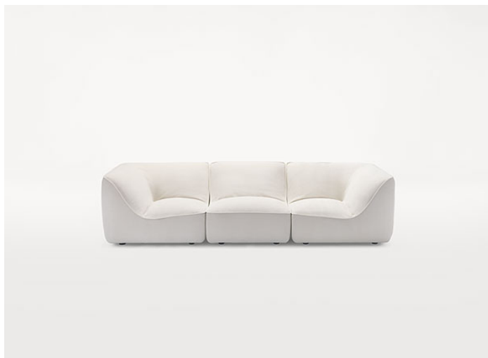
B33AS + D33B + B33AD