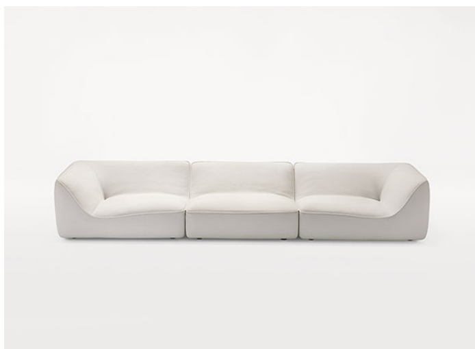
B33ES + B33H + B33ED