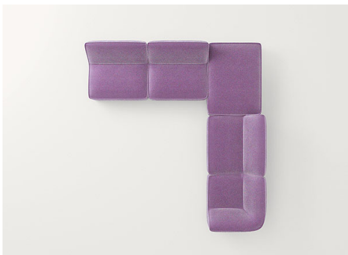
n°3 B33H + B33F + B33AD