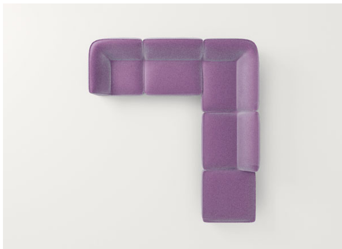
B33AS + n°2 B33H + B33ES + B33G