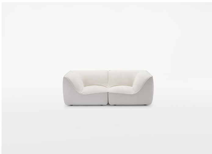
B33AS + B33AD