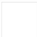
TACR02 lana / Wool TACR02S seta / Silk