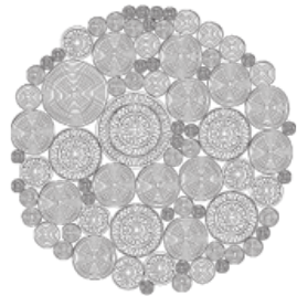
cm Ø 250 98"