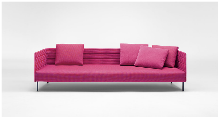
Frame on, Rope braid RT1511, cushions Luz LT011, Brio BT151911