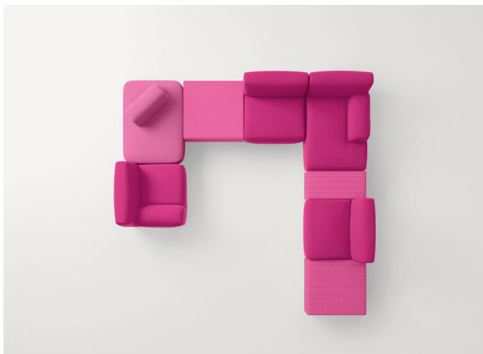
B87AE + Jolly pouf B68B + Orlando B77E + Island side table B11PA + B87CE + B87EE + Frame side table B18K + B87CE + Frame side table B18J