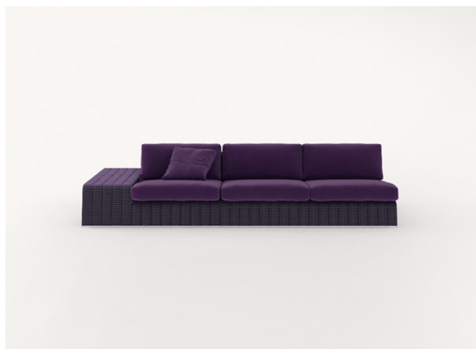
B18SCTS + n° 2 B18SC