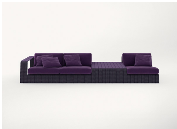
B18SS + B18SCTD + B18SCTS