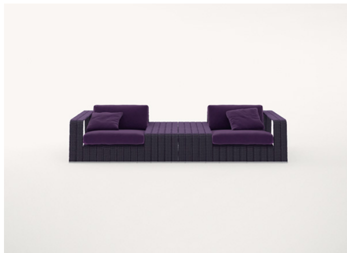
B18TS + B18TD