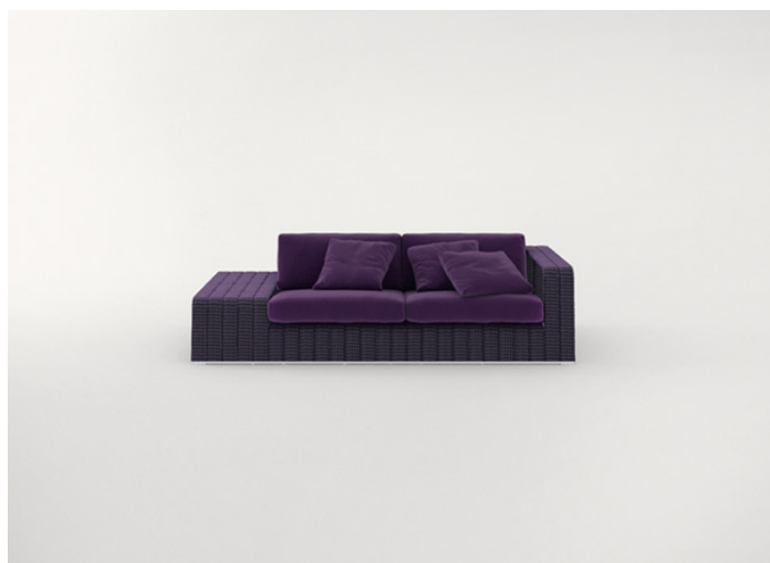
B18SCTS + B18SD