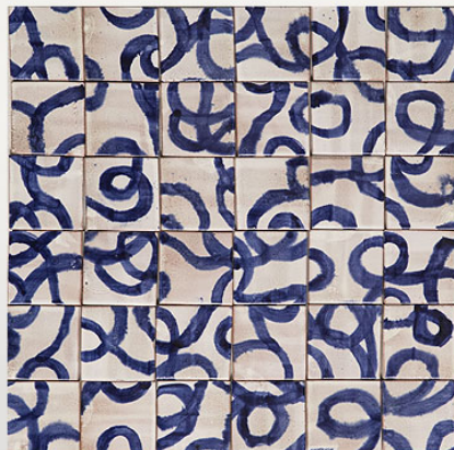
PML032, maiolica acquerellata/watercoloured majolica cm 7x7