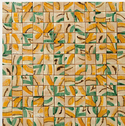
PMS112, maiolica acquerellata/watercoloured majolica cm 3,5x3,5