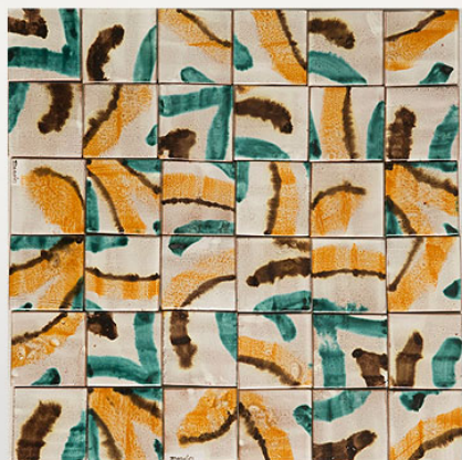
PML112, maiolica acquerellata/watercoloured majolica cm 7x7