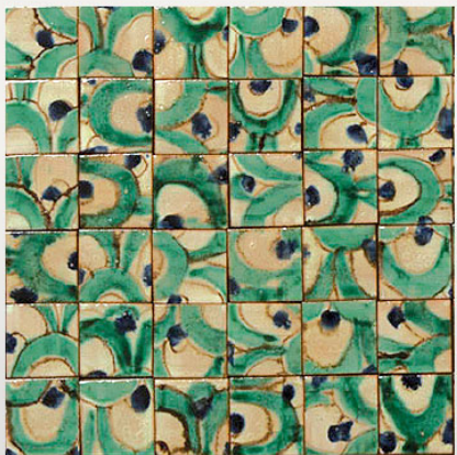
PML122, maiolica acquerellata/watercoloured majolica cm 7x7