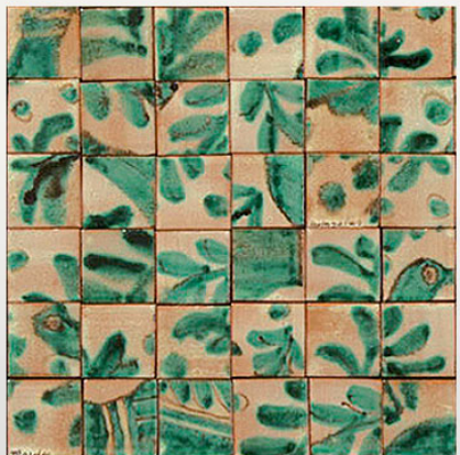
PML062, maiolica acquerellata/watercoloured majolica cm 7x7