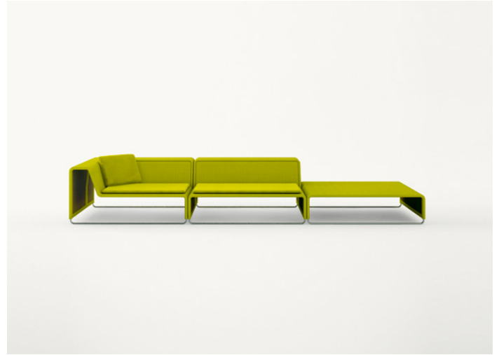
B11S + B11C + B11PB