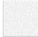
TAEB05 modulo module