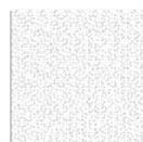
TAEB05 modulo module