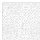
TAEB03 modulo module