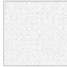
TAEB03 modulo module