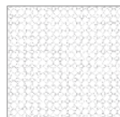
TAEB01 modulo module