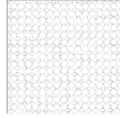
TAEB01 modulo module