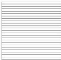
cm 200x200 79" x 79"