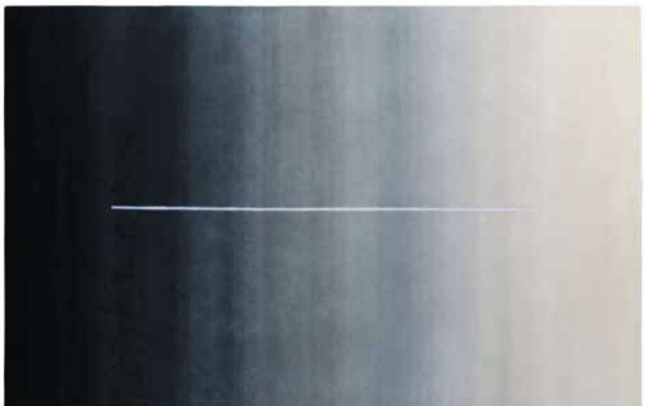
NODUS, Hiatus 3 model - Design: Gustavo Martini - nodusrug.it