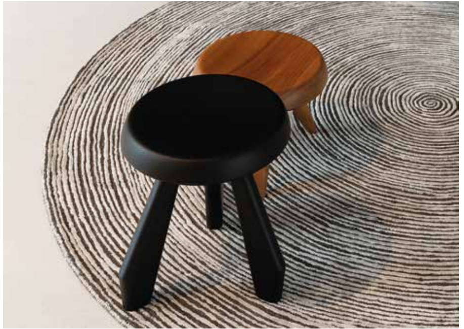
CASALIS, Vlas model - Design: Anita Kars - casalis.be

Les textures, chargées en combinaisons de fils, racontent un vécu, imitent l'usure du temps et offrent une sensation de volume aux faux-unis, une tendance très présente dans toutes les collections où les tapis, aux couleurs tons sur tons, s'assouplissent. Les mélanges de matières brouillent les pistes : tissages ou tressages ? Les effets de chaîne et trame dessinent des armures complexes et élaborées, évoquant une certaine matérialité qui prend source dans la nature et ses éléments. C'est le règne des effets chinés, jaspés, filetés, tweedés, brodés, des jeux de points, des chevrons, des cannages.