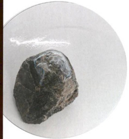
Rots duwt glas naar omhoog: salontafeltje 'Slump Rock' van Paul Cocksedge