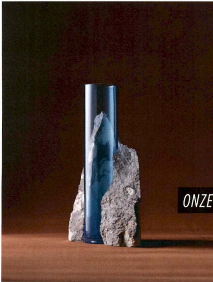
Restmarmor versus mondgeblazen glas: 'Drill Vase' van StudioEO