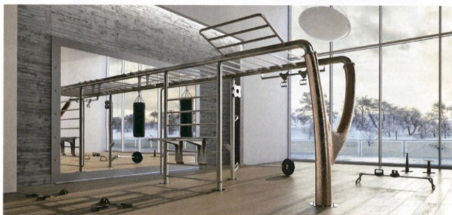
Оборудование для тренажёрного зала MyBeast, коллекция Indoor, MyEquilibria

—Как сказалась отмена ежегодной Миланской выставки на состоянии интерьерной моды и интерьерного рынка?