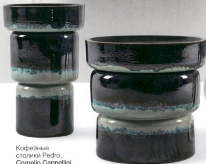
Кофейные столики Pedro, Cornelio Cappellini , corneliocappellini.com