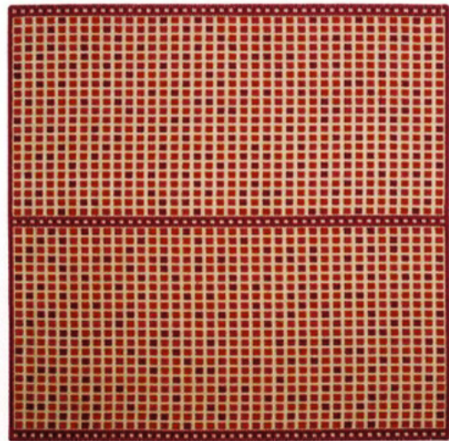
PAOLA LENTI, Orto model - Design: CRS Paola Lenti - Photo: © Sergio Chimenti - paolalenti.it

The rich textures, with their different combinations of yarns, tell a story, imitate the wear and tear of time and give a feeling of volume to the semi-plains, a trend that is very visible in all the collections, where rugs with tone on tone colours take on a softer note. The mix of materials blurs the lines: Weaving or braiding? The warp and weft effects create complex and elaborate weaves, evoking a certain materiality that takes its source in nature and its elements. It is very much the reign of heathered, worsted, threaded, tweeded, embroidered, stitched, herringbone and wickerwork effects. ▶