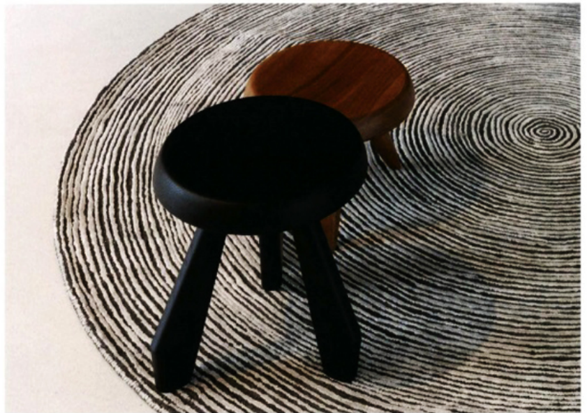
CASALIS, Vlas model - Design: Anita Kars - casalis.be

L es textures, chargées en combinaisons de fils, racontent un vécu, imitent l'usure du temps et offrent une sensation de volume aux faux-unis, une tendance très présente dans toutes les collections où les tapis, aux couleurs tons sur tons, s'assouplissent. Les mélanges de matières brouillent les pistes : tissages ou tressages ? Les effets de chaîne et trame dessinent des armures complexes et élaborées, évoquant une certaine matérialité qui prend source dans la nature et ses éléments. C'est le règne des effets chinés, jaspés, filetés, tweedés, brodés, des jeux de points, des chevrons, des cannages.