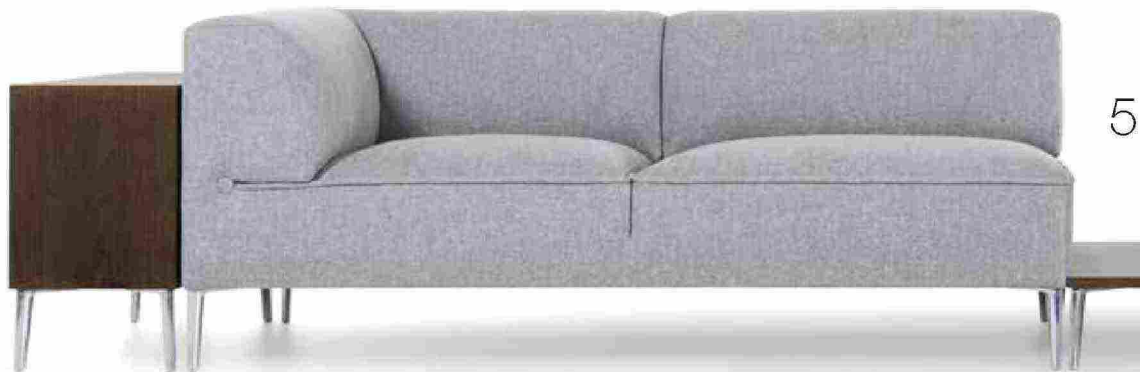
5. MOOOI Il Sofa So Good è disegnato da Marcel Wanders studio. Un sistema di divani modulari che combina design intelligente e proporzioni generose. Componibile a seconda delle esigenze comprende otto diversi moduli imbottiti, due tavoli e tre ripiani. 6. PAOLA LENTI La serie di imbottiti Move è composta da divani e sedute modulari disponibili in due altezze e quattro profondità. La dimensione degli elementi e la possibilità di scegliere l'altezza, grazie a differenti tipologie di piedini, permettono di realizzare varie composizioni.

Questi infatti si adattano con facilità a tutte le soluzioni abitative e alle diverse occasioni come ricevere ospiti inattesi, grandi rimpatriate che necessitano di ampi spazi centrali o eventi più intimi come un tè tra colleghi. Grazie ai loro moduli separati, questi divani si possono assemblare e scomporre facilmente, permettendo così di ripensare lo spazio in maniera sempre diversa».