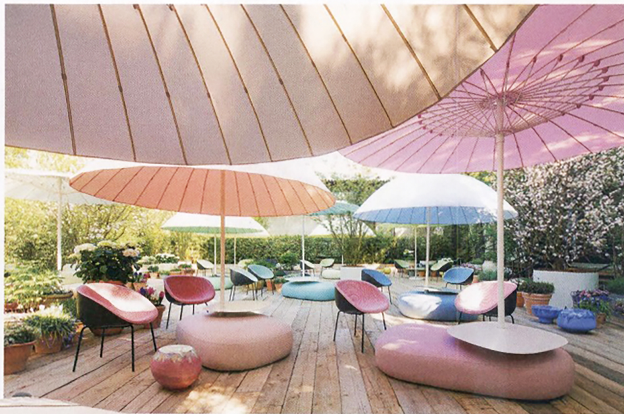
Bistro-parasols uit The Landscapes-collectie van Paola Lenti

Let bij aanschaf behalve op het ontwerp van de parasol ook op het materiaal van het doek en de mechaniek: is het een kwestie van duwen, van draaien of van 'katrollen'?