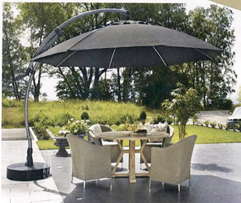
Sun Gardens Easy Sun (€ 989)