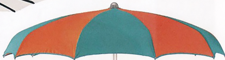
Strandparasol Paola (€ 356,30), verkrijgbaar bij Jotex. Met haakjes voor badkleding

Een ronde, een vierkante of een rechthoekige parasol? Dat is een kwestie van smaak, maar ook van praktisch inzicht. Zo lijkt het logisch om in het gat van een vierkante buitentafel een vierkante parasol te steken – mooi congruent. Maar de baleinen van een vierkante parasol zijn vaak erg lang, wat ervoor kan zorgen dat inklappen boven de tafel nét niet lukt.