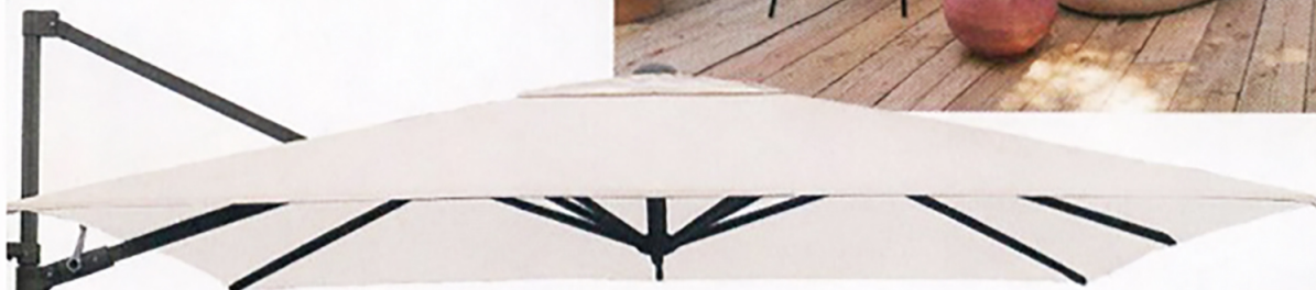
Muurparasol van Shadowline (€ 179)