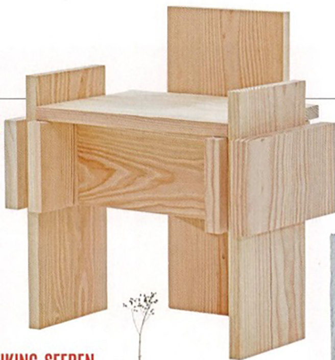
Zuinige stoel van Pettersen & Hein.