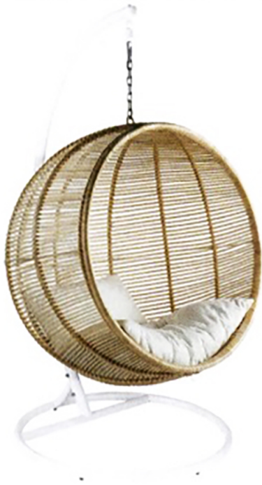
Am Ball bleiben Wunderbar geborgen fühlt man sich im »Summer Ball«, der sowohl indoor als auch outdoor verwendbar ist. iconmobel.com