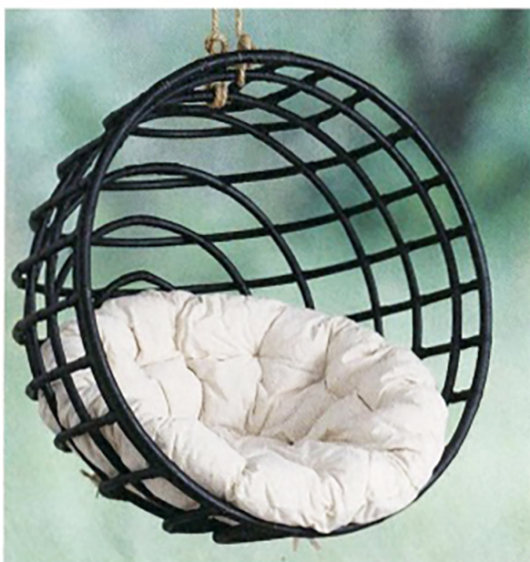
Cooler Sache Hängesessel müssen nicht immer Naturfarben sein. Wer mehr auf den Industrial Look steht, wird den »Boltze« lieben. skandeko.de