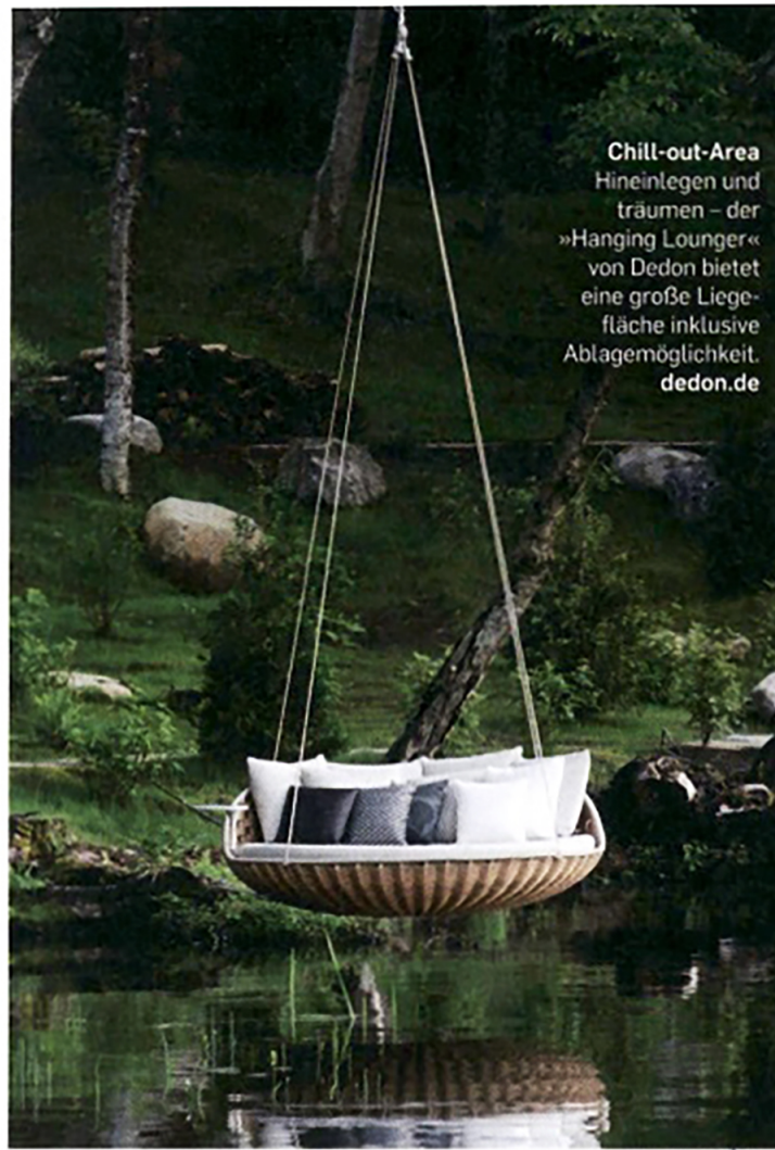
Chill-out-Area Hineinlegen und träumen – der »Hanging Lounger« von Dedon bietet eine große Liegefläche inklusive Ablagemöglichkeit. dedon.de