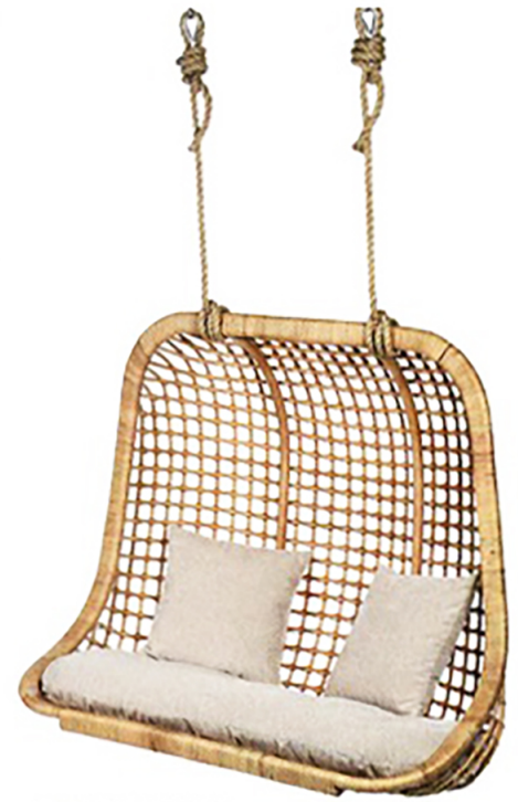
Zum Entspannen Der Outdoor-Rattan-Hängerkorb »Ayana« bietet genügend Platz, um die Lieblingszeitschriften griffbereit zu haben. depot-online.at