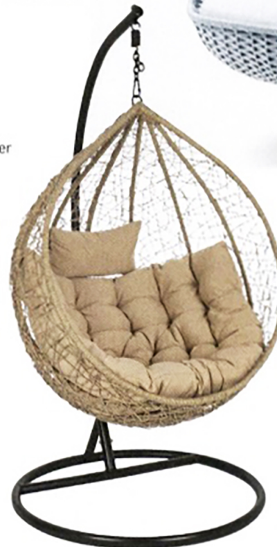
Verschnörkelt Die kunstvollen Verflechtungen des Hängesessels »Amirantes« von Westwing machen einiges her. westwingnow.de