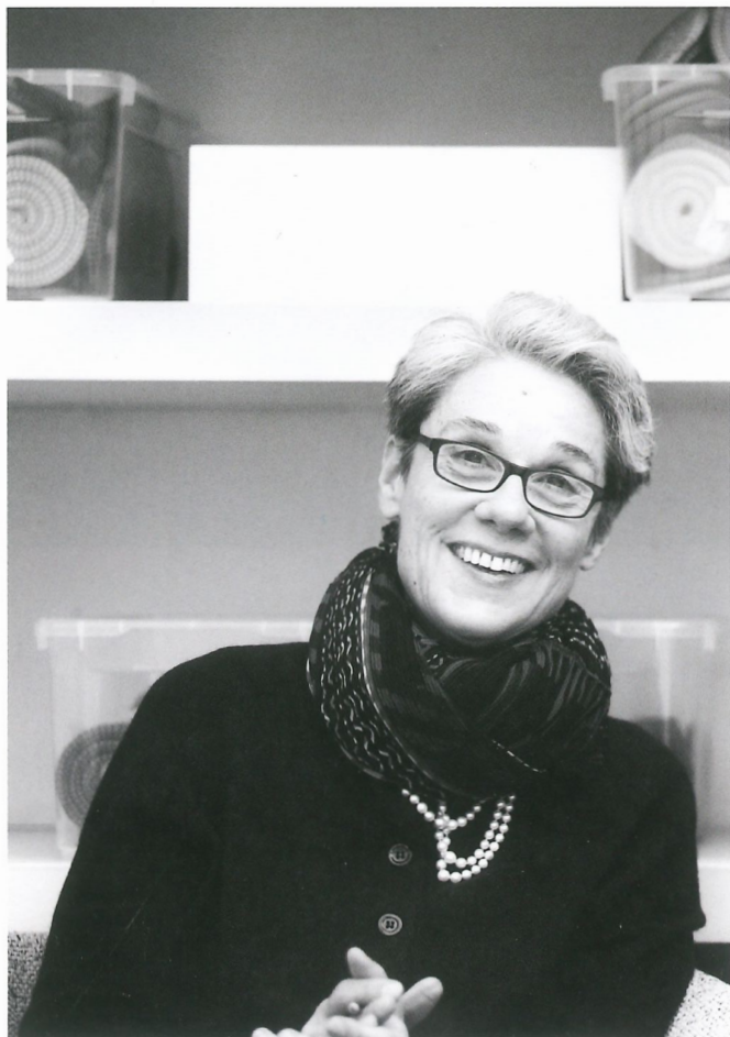
PAOLA LENTI

Nous entretenons depuis toujours d'excellentes relations avec la Belgique et nous y avons fait nos premiers pas pour faire connaître Paola Lenti hors d'Italie. À l'époque nous étions encore une jeune entreprise artisanale. Nous y avons trouvé un agent, des distributeurs et des particuliers qui ont immédiatement cru en nous.