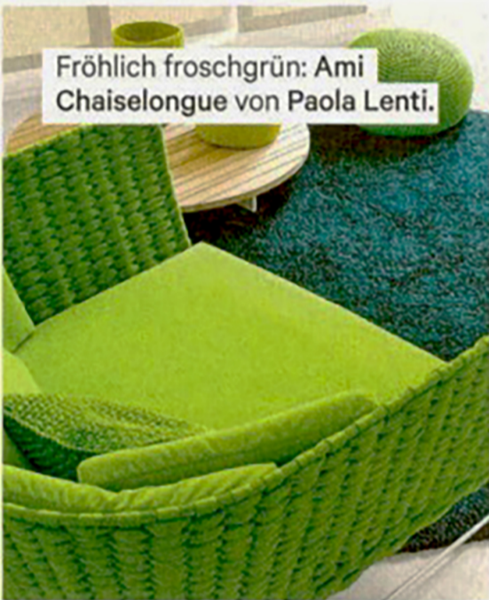
Fröhlich froschgrün: Ami Chaiselongue von Paola Lenti.