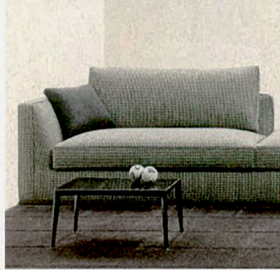
Möbel tragen Karo, z. B. Richard von B&B Italia.