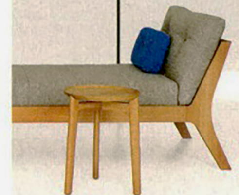
Natürlich kommt das Daybed Mellow von Zeitraum rüber.

Müßiggang habe das Zeug zum Glücklichen, meint so manch kluger Kopf. Die Chaiselongue ist dazu das passende Möbel. Eine Auswahl.