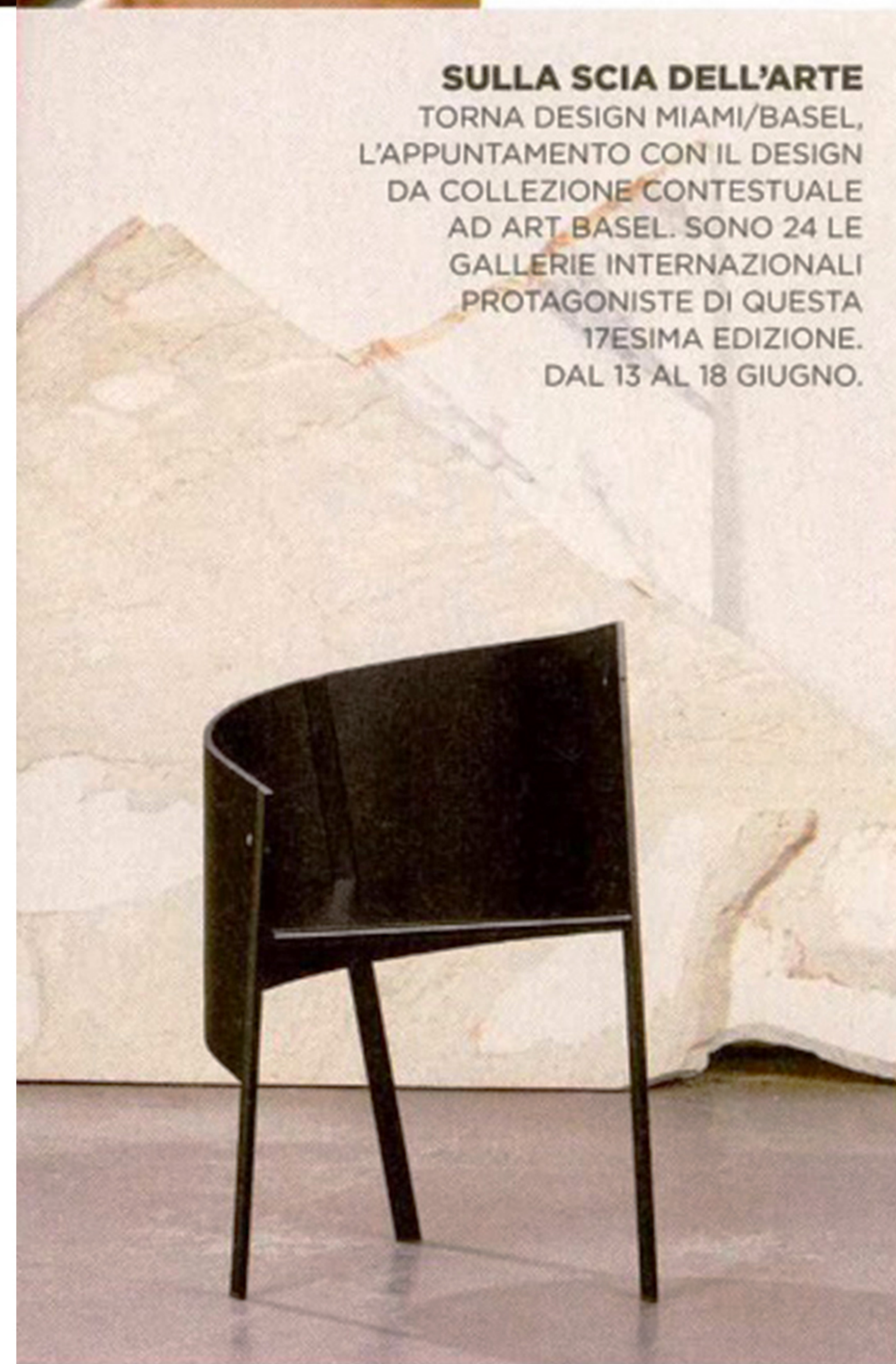
SULLA SCIA DELL'ARTE TORNA DESIGN MIAMI/BASEL, L'APPUNTAMENTO CON IL DESIGN DA COLLEZIONE CONTESTUALE AD ART BASEL. SONO 24 LE GALLERIE INTERNAZIONALI PROTAGONISTE DI QUESTA 17ESIMA EDIZIONE. DAL 13 AL 18 GIUGNO.