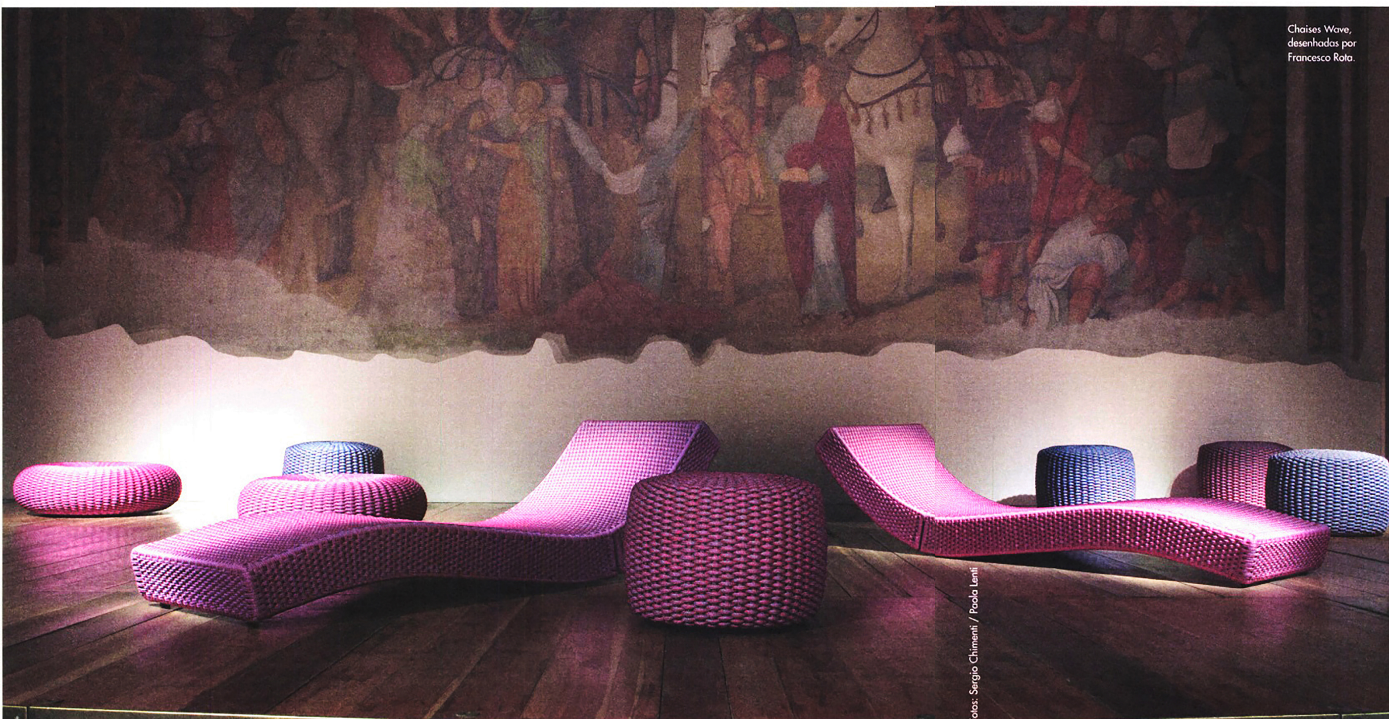
Chaises Wave, desenhadas por Francesco Rota.